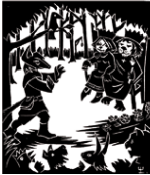
houtsnede Reynaert aan het hof

Terzelfder tijd stelde kunstenaar Wim de Cock zijn prachtige houtsnedes over Reynaert de Vos ten toon. Rik van Daele gaf een inleiding over het werk van deze Wase kunstenaar.