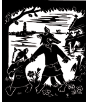
houtsnede Reynaert en Grimbeert bij de priorij van de zwarte nonnen