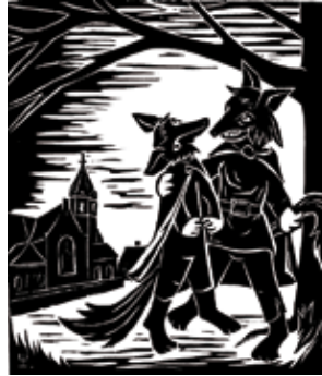
houtsnede Reynaert en Isegrim bij Belsele onder eenen boom

Beste leden, vrienden en sympathisanten,