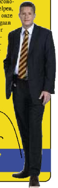
Frank Vanhecke Voorzitter Vlaams Belang

Willen wij onze economie er bovenop helpen, dan moeten we onze eigen boontjes gaan doppen. Zonder Waalse bemoeienissen. Alle Vlamingen hebben er dus belang bij dat Vlaanderen onafhankelijk wordt.